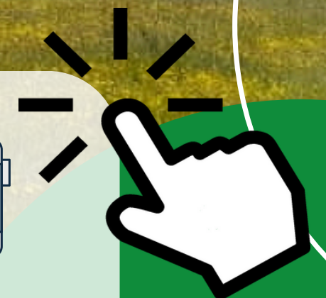
CLICK EN ICONO